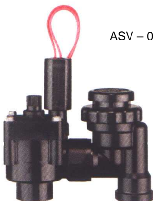
ASV – 075 – 3/4"