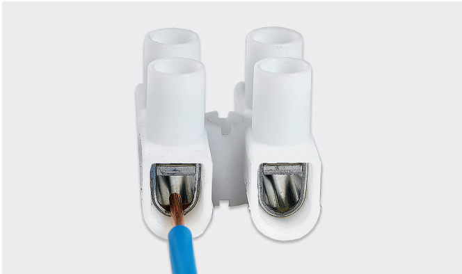
Einfache Leitereinführung durch verbessertes Design Improved design for easy wire entry