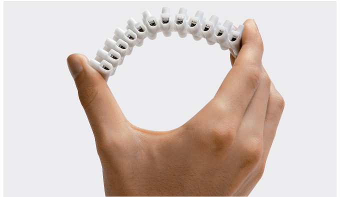
Höchste Biegsamkeit Supreme pliability