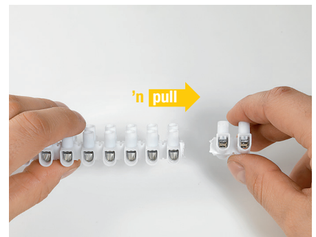
Einfach zu trennen - „twist 'n pull“ Easy to divide “twist 'n pull“

Bei nicht lagefixierter Verwendung beträgt die Nennspannung für EKL 0S und EKL 1S 250V In loose applications the maximal voltage for EKL 0S and EKL 1S is 250V